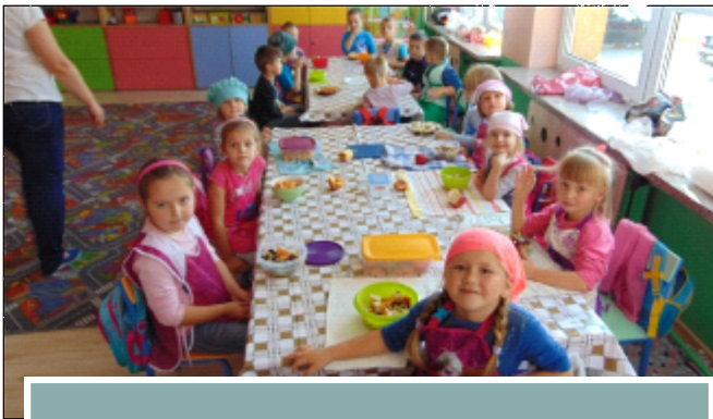
SMACZNIE, ZDROWO I KOLOROWO