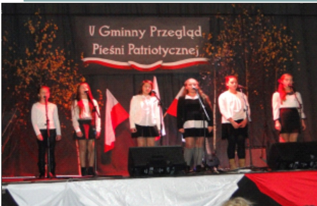
V PRZEGLĄD PIEŚNI PATRIOTYCZNEJ