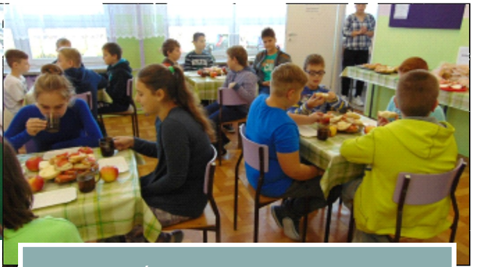
„ŚNIADANIE DAJE MOC