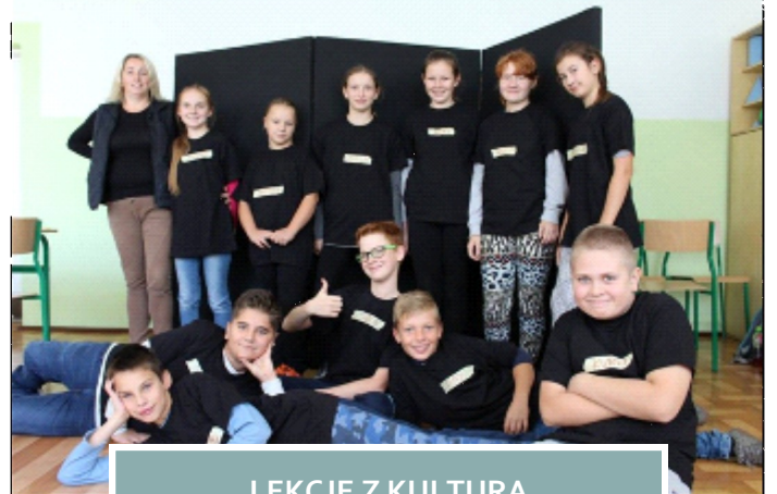
LEKCJE Z KULTURĄ