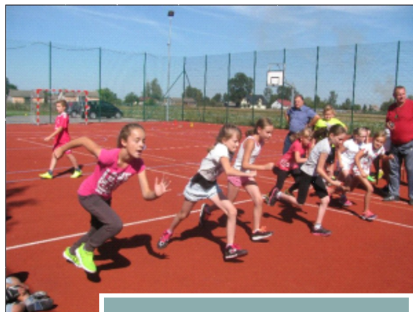
EUROPEJSKI TYDZIEŃ SPORTU