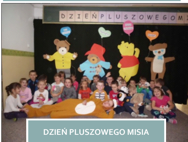
DZIEŃ PLUSZOWEGO MISIA