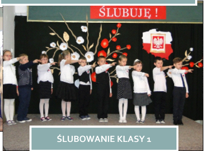
ŚLUBOWANIE KLASY 1