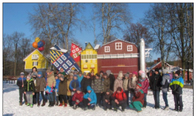
WYCIECZKA KLAS STARSZYCH NA FARMĘ ILUZJI