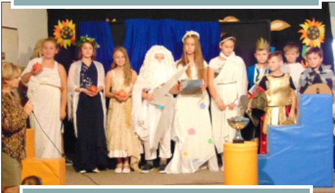
POKAZ MODY STAROŻYTNEJ